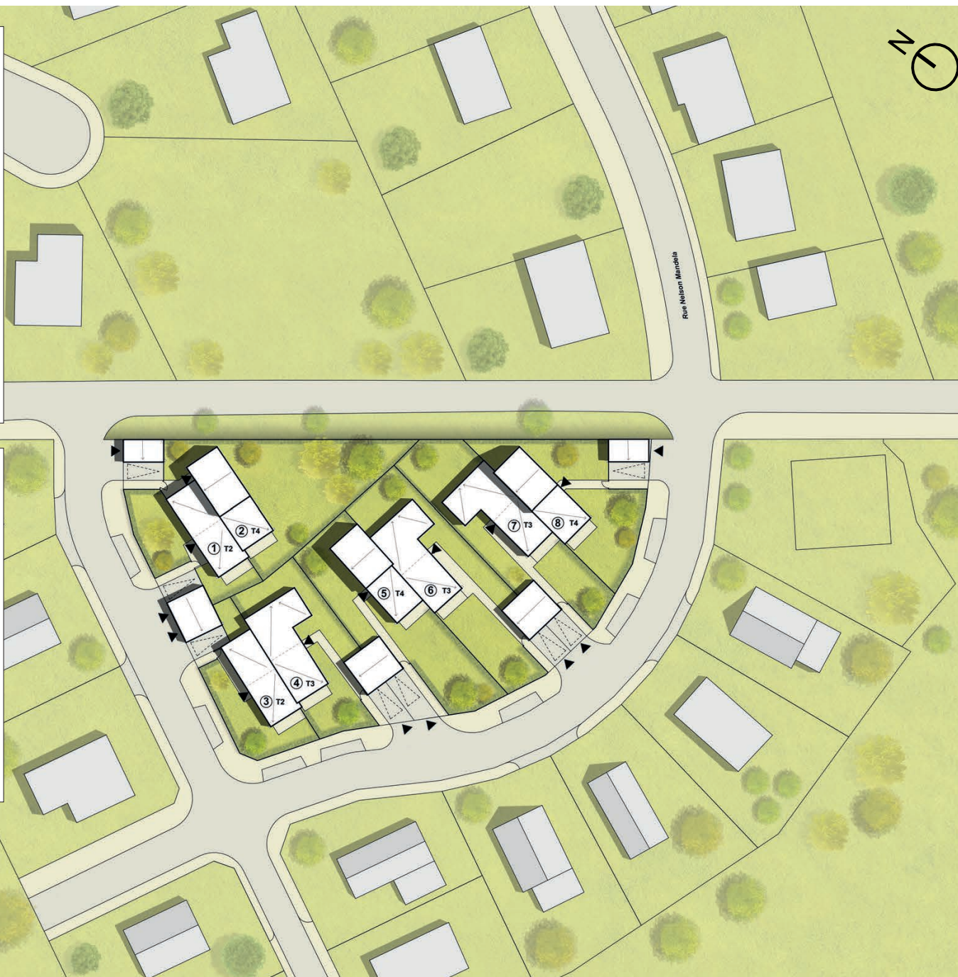
PLAN MASSE - 1/500e

Tous des logements sont disposés suivant un axe Nord / Sud et sont repartis afin que chacun dispose d'un espace largement engazonné devant son séjour . De plus, l'intimité visuelle est préservée par une disposition réfléchie des espaces et des percements.