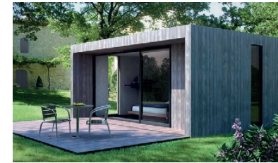
TYPOLOGIE DE MATÉRIAUX