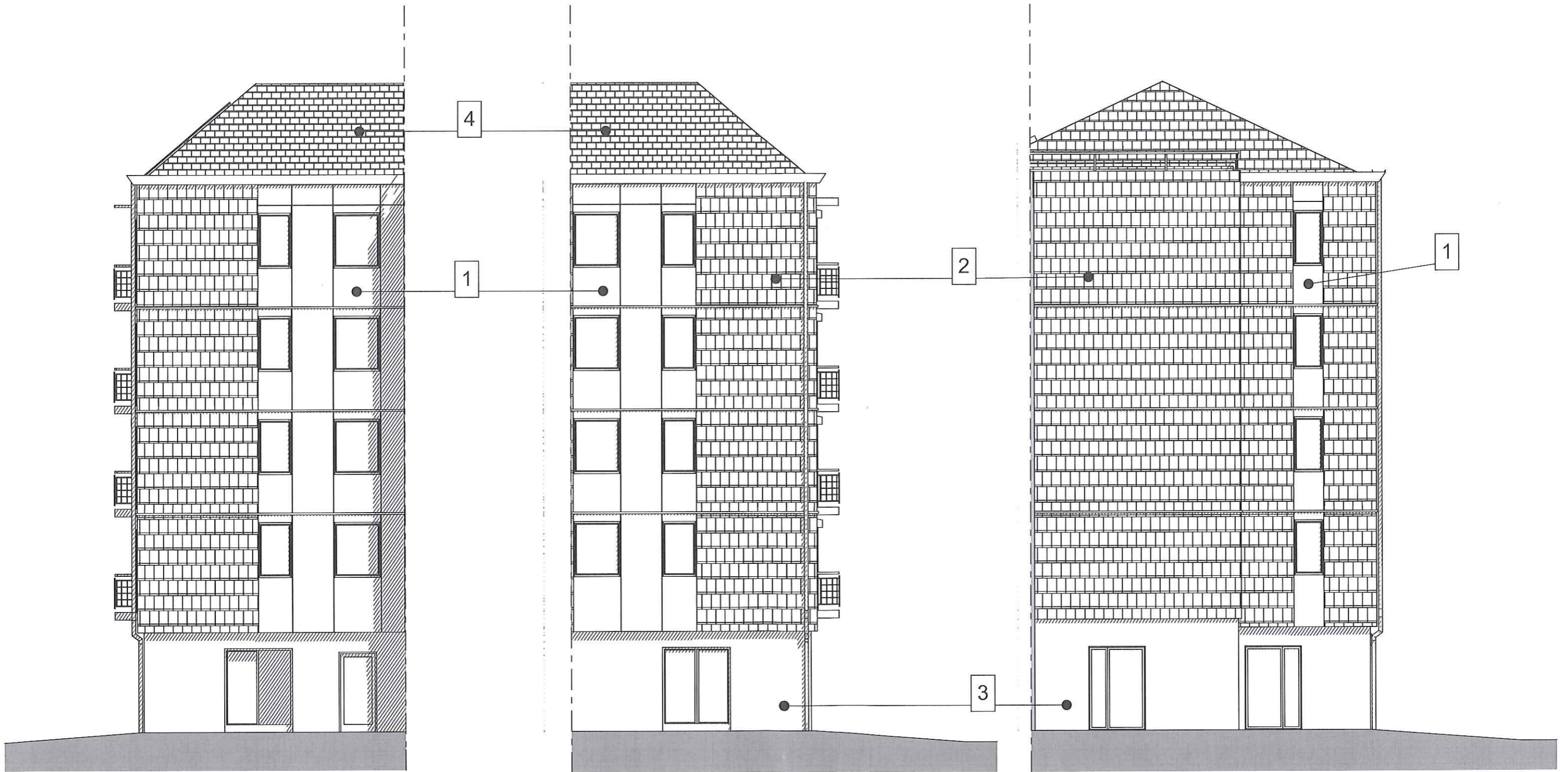
Façades Est 2