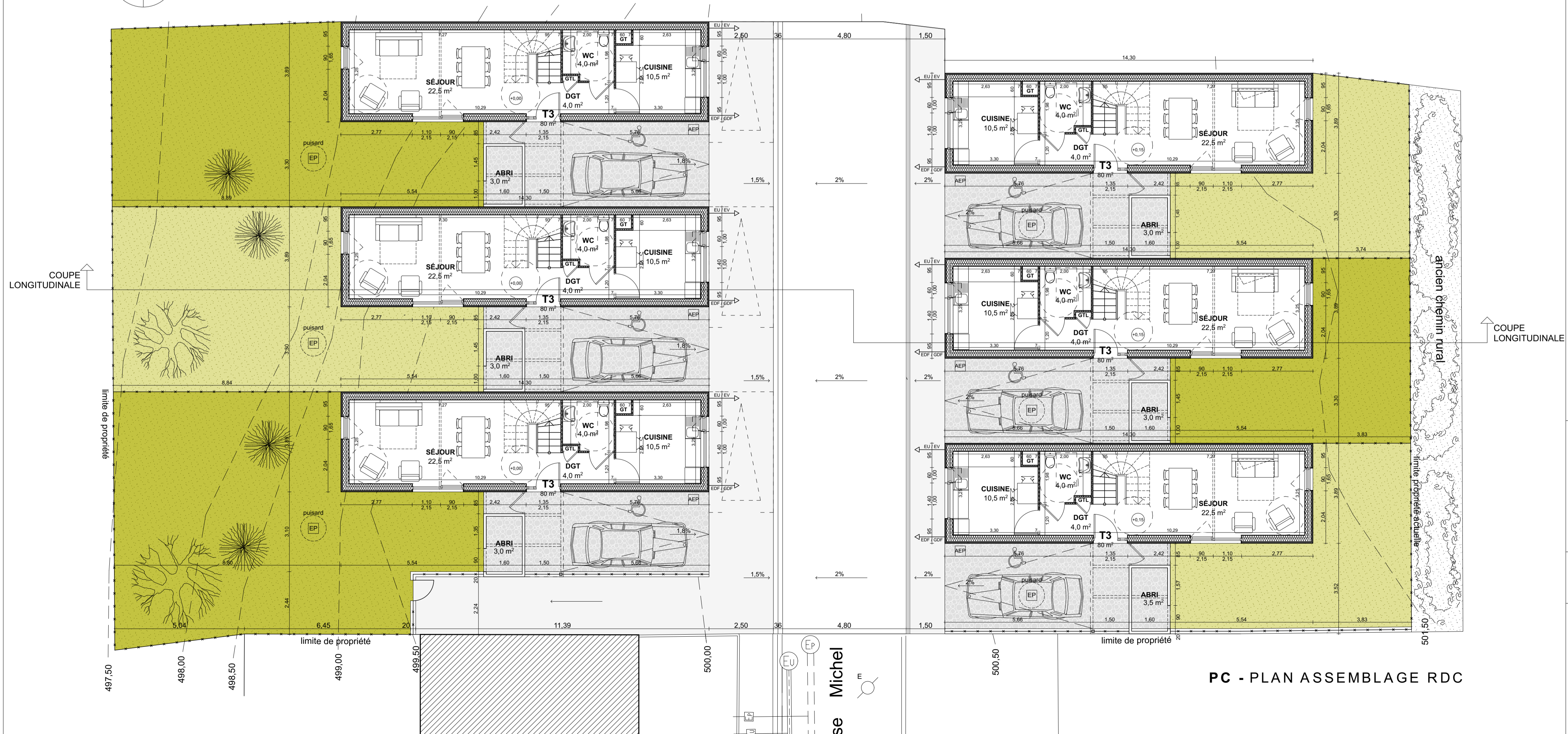
PC - PLAN ASSEMBLAGE RDC