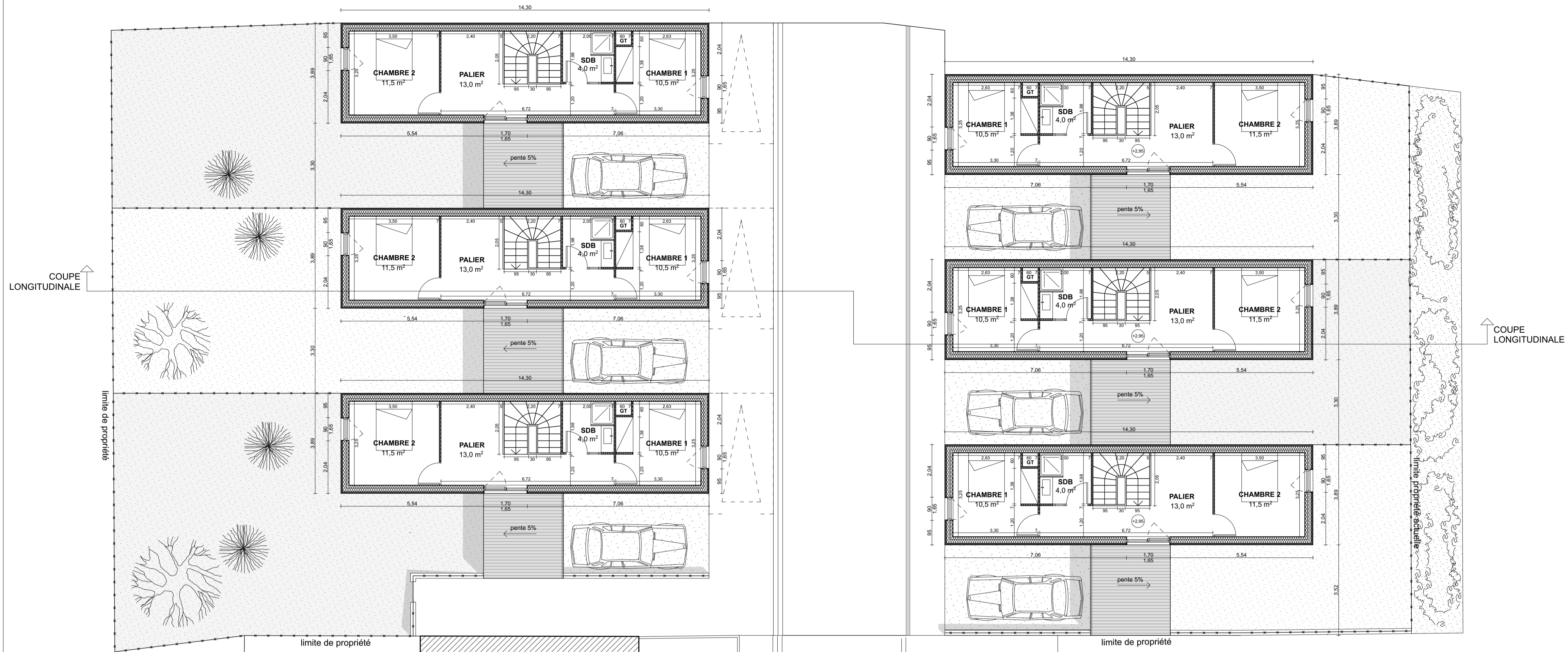
PC - PLAN ASSEMBLAGE R+1