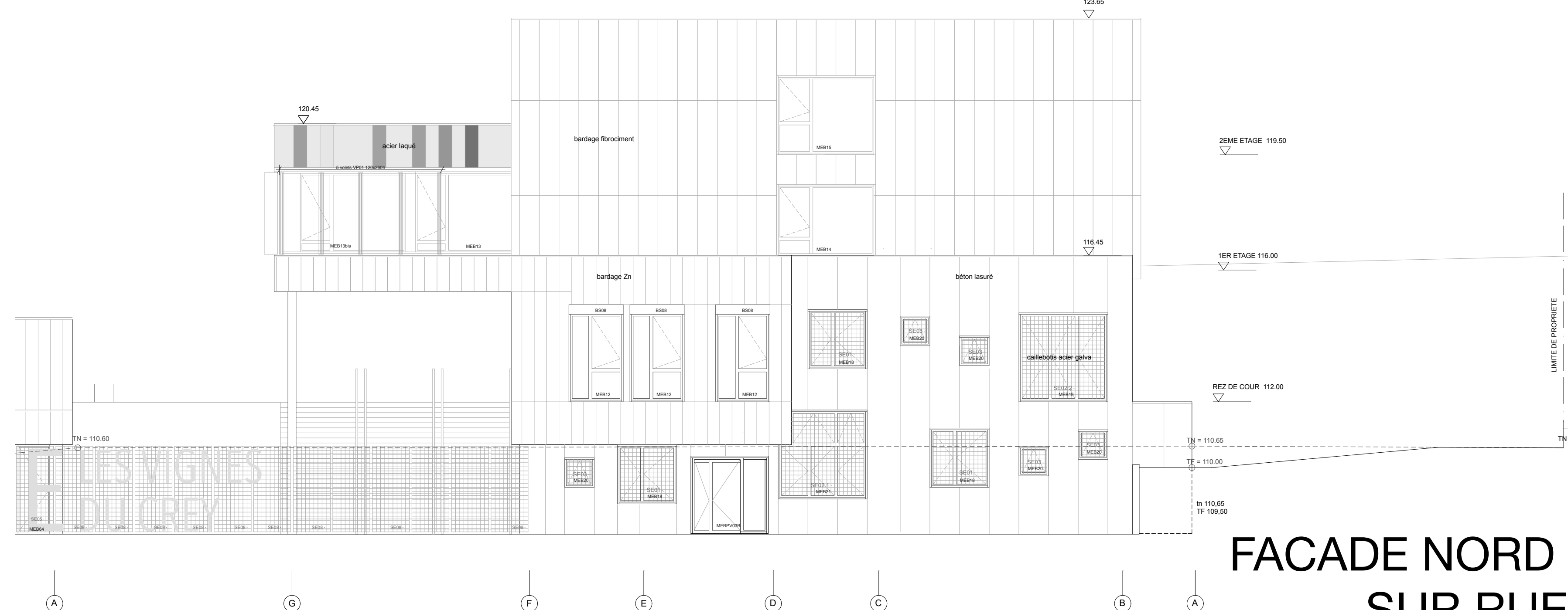
FACADE NORD SUR RUE