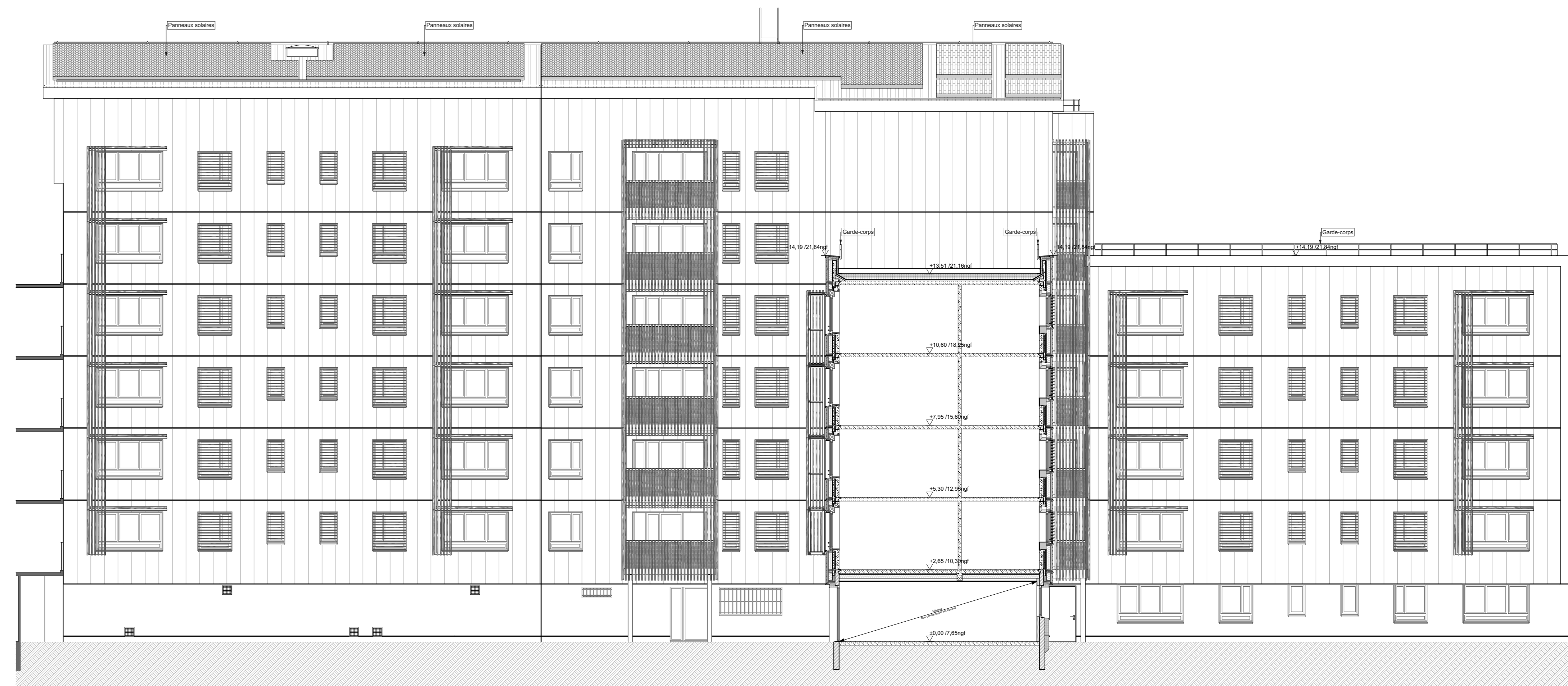
Coupe sur 509