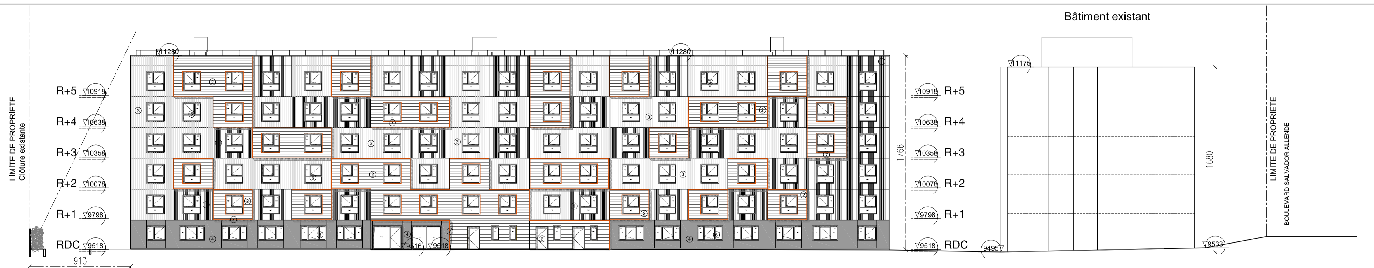
FAÇADE NORD A A'