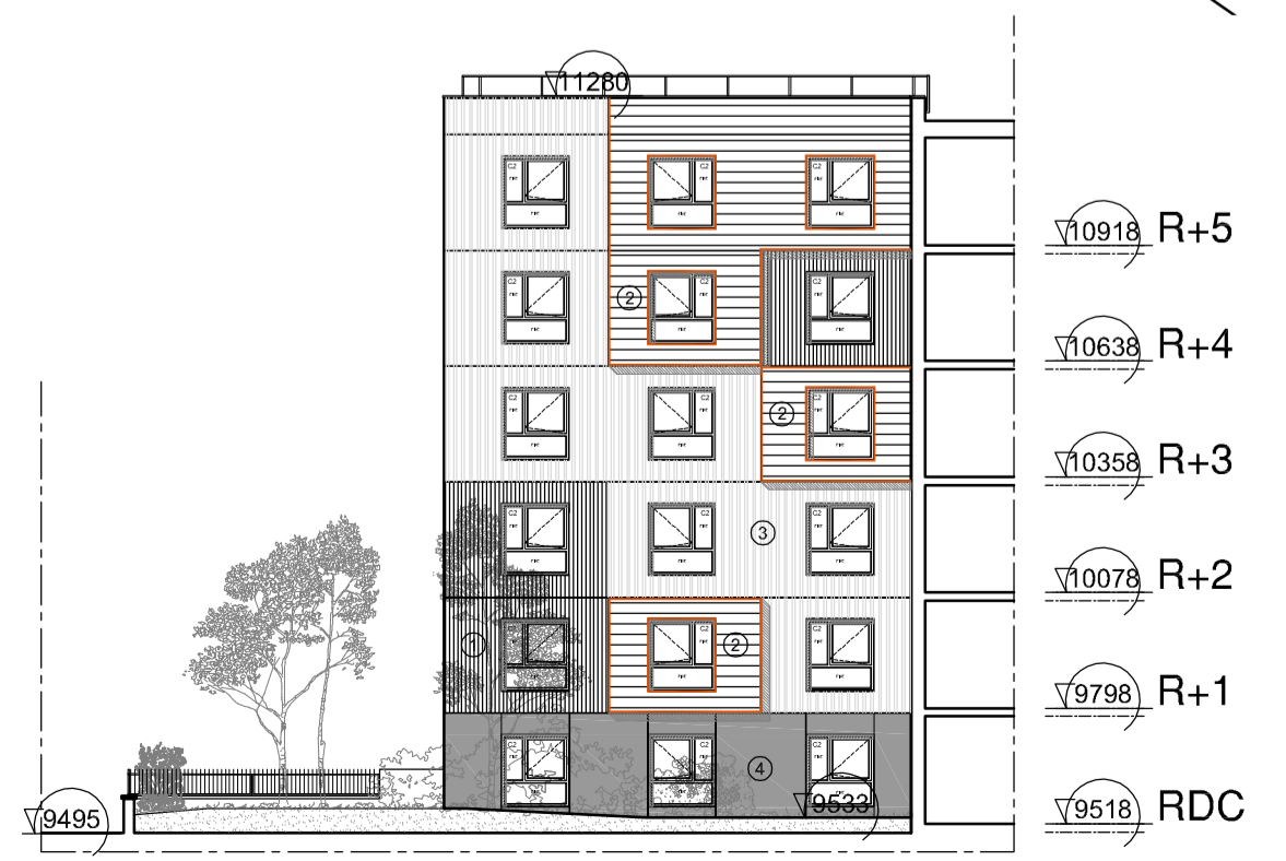
FAÇADE EST E E'