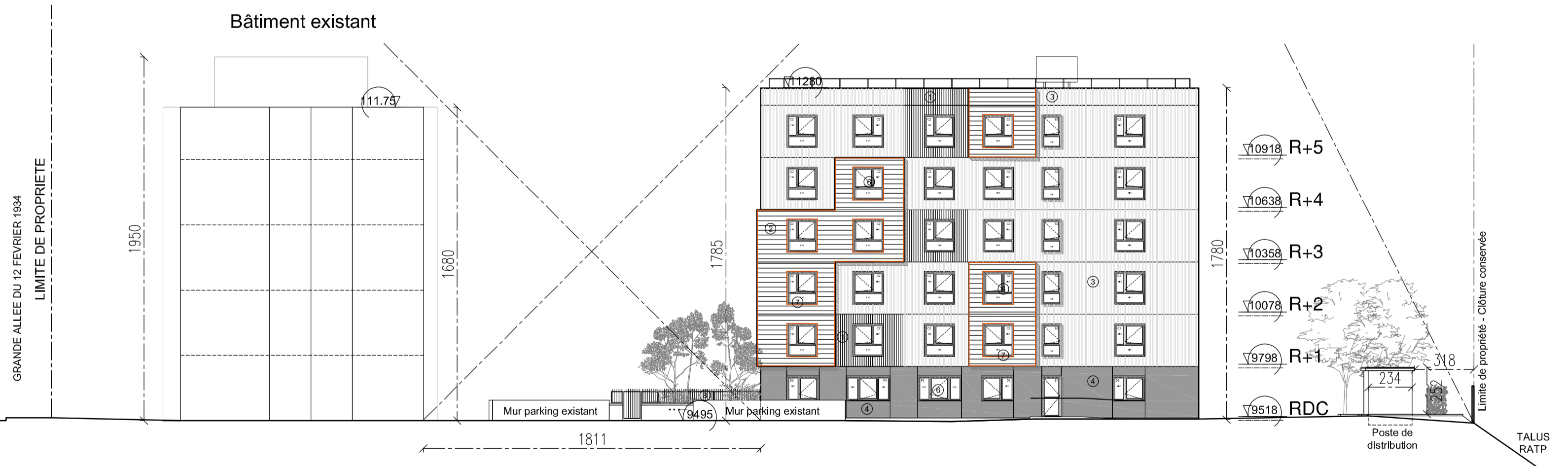
FAÇADE EST C C'